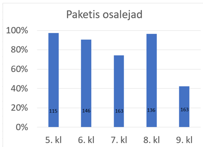
Joonis 1. Mugavuspaketis osalejate osakaal lendude põhisel

E. Hint: Annan ülevaate järgmiste joonistega.